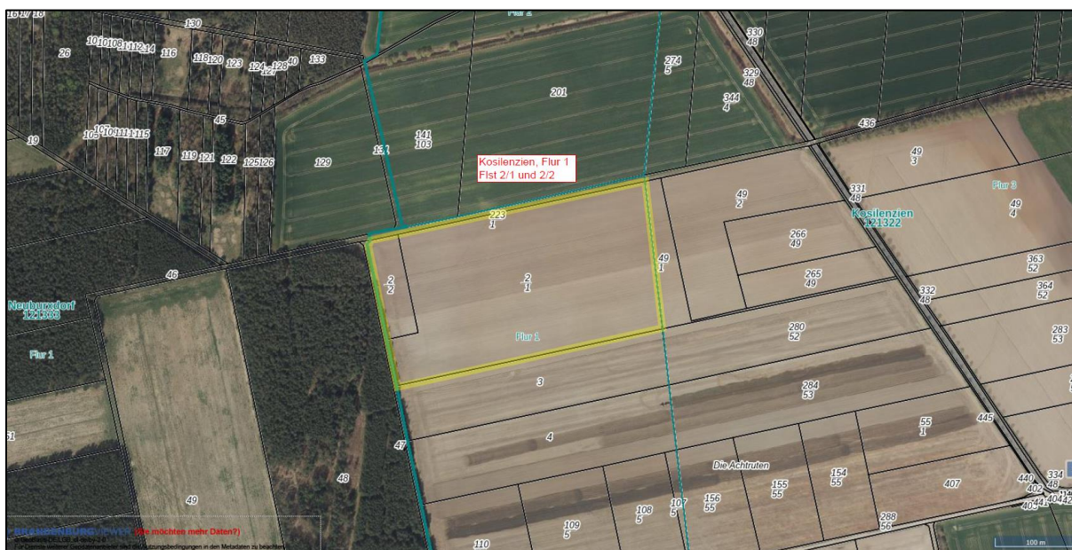
Abbildung 2: Luftbild Flurstücke 2/1 und 2/2, Flur 1, Kosilenzien