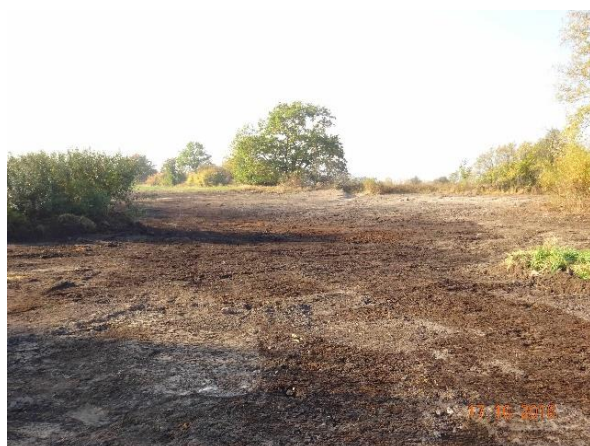
Nach Abschluss der Erdbauarbeiten