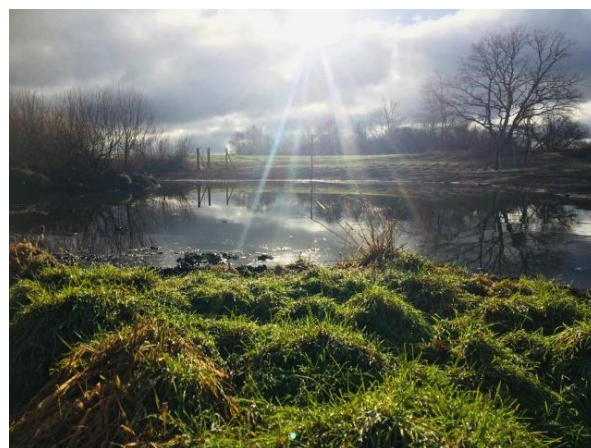
Wasserfläche nach den ersten Regenfällen

Weiterführende Informationen können Sie bei Bedarf unter unten angegebener Adresse erhalten.