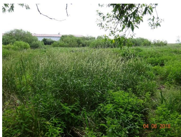
Röhthpfehl vor der Renaturierung

Die Umsetzung der Maßnahme hat im Sommer 2018 begonnen.