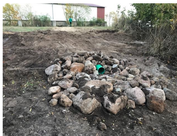
Zusätzliche Wassereinspeisung durch Regenwasserzufuhr von Dachflächen