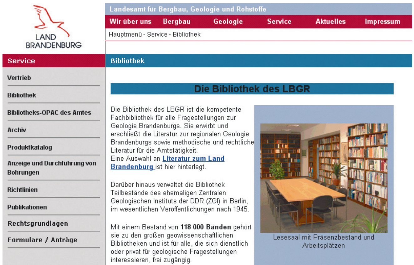
Abb. 4 Homepage der Bibliothek des LBGR

gegeben werden, um dort die Ergebnisse mehrerer Anfragen zu sammeln.