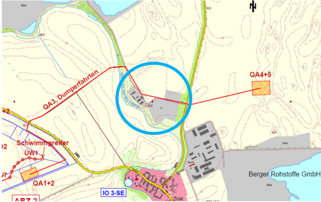
Abb. 1: Kennzeichnung des Gebäudekomplexes nördlich der Ortslage Altenau

per Empfangsbestätigung „genehmigt. Da der Rückbau des Gehöfts vor den Dumperfahrten und dem Bau der Bandanlage erfolgt, entfällt dieses Gehöft als Immissionsort.