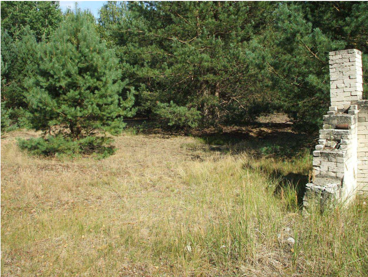
Abbildung 5: Probefläche 3 mit Kiefernvorwald und altem Mauerwerk