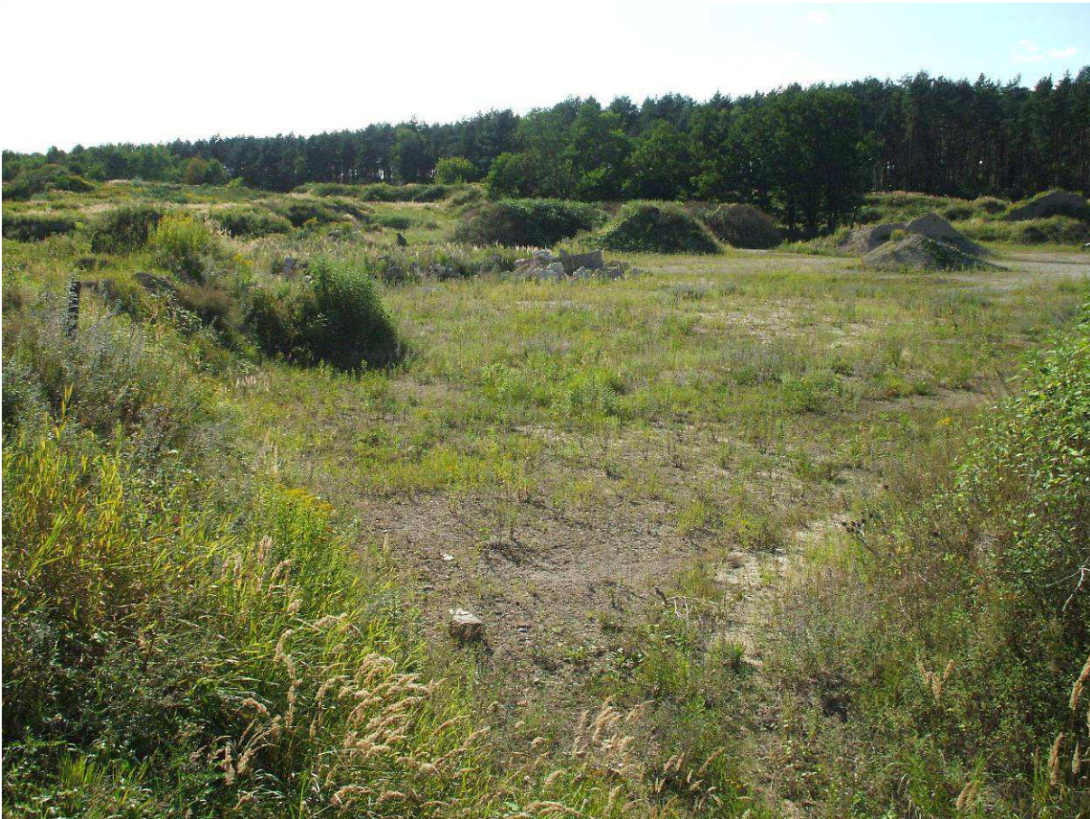
Abbildung 3: Typischer Aspekt der Probefläche 1

Die Größe der Probefläche betrug ca. 4,5 ha.