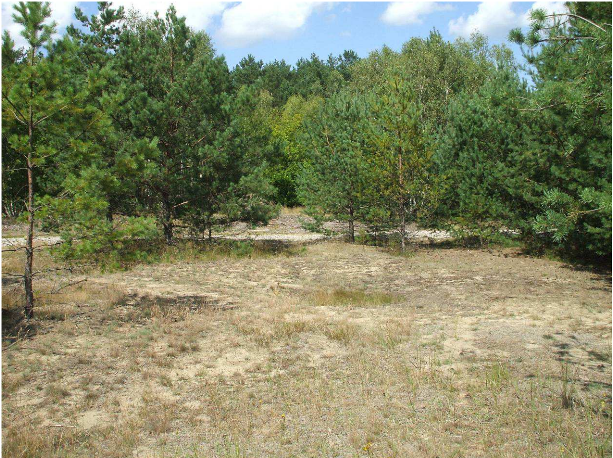
Abbildung 4: Probefläche 2 mit Silbergrasrasen und Kiefernaufwuchs