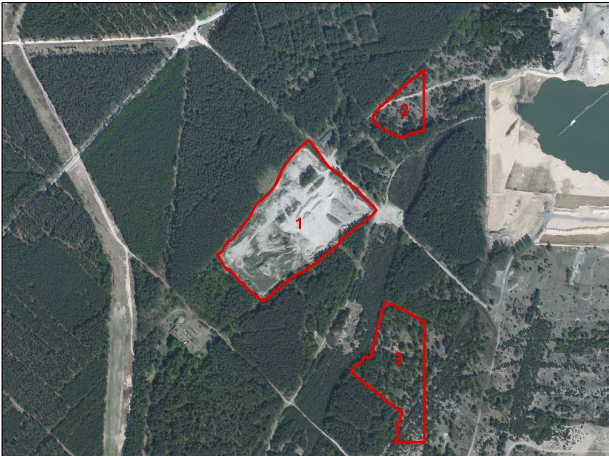
Abbildung 2: Abgrenzung der betrachteten Flächen

Während einer Übersichtsbegehung wurde auf Basis einer zur Verfügung gestellten Biotoptypenkartierung diejenigen Teilgebiete des Untersuchungsraumes ausgewählt, die vom Augenschein her als Lebensraum für Stechimmen und Heuschrecken in Betracht kamen. Dabei handelte es sich um offene oder halboffene Biotope, während der übrige Teil des Untersuchungsgebietes aus Wald- und Forstbiotopen bestand. Diese haben nur eine sehr geringe Eignung für die betrachteten Artengruppen. Im Ergebnis wurden drei größere Areale einer näheren Betrachtung unterzogen, sie sind in der nachfolgenden Abbildung 2 dargestellt. Daneben gab es noch einige kleinere Potentialflächen, meist an den Rändern der unbefestigten Wege.