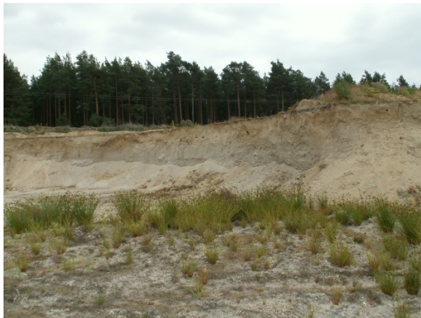
Abb. 3 Steilwand mit Erosionserscheinungen