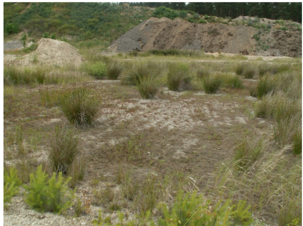
Abb. 4 ausgetrocknetes Kleingewässer