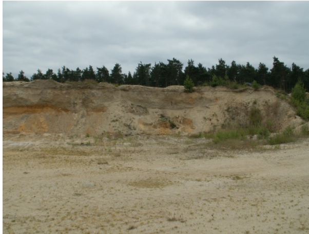
Abb. 1 Steilwand mit Erosionserscheinungen