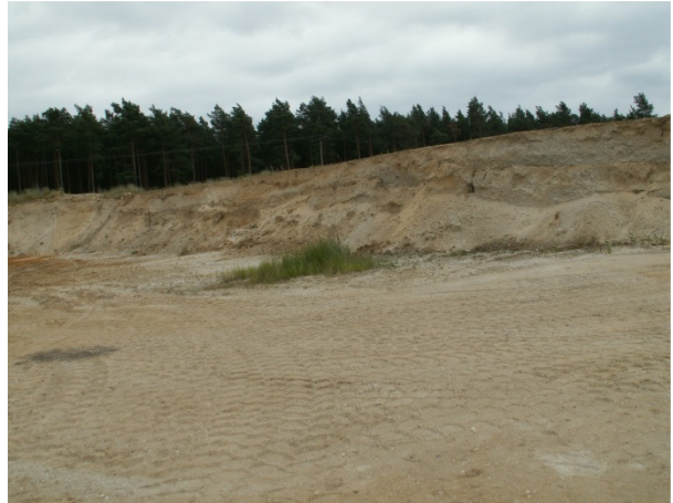
Abb. 2 Steilwand mit Erosionserscheinungen